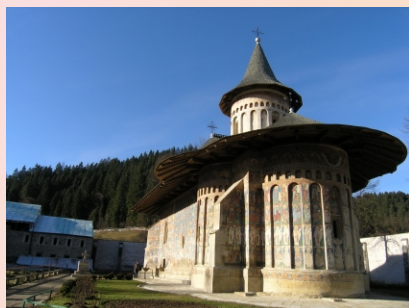
M-rea Voroneț, supranumită „Capela Sixtină a Europei Răsăritene”